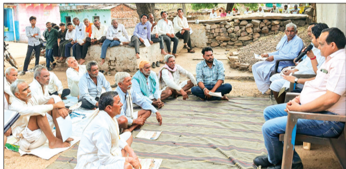
हरिभूमि न्यूज ► गुना

जिले में रबी वर्ष 2025-26 की फसलों की कटाई का कार्य तेजी से जारी है। कटाई के बाद कुछ किसानों द्वारा नरवाई (फसल अवशेष) जलाने की घटनाओं को गंभीरता से लेते हुए जिला प्रशासन ने सख्त कदम उठाए हैं। नरवाई जलाने से वायु प्रदूषण, मृदा की उर्वरता में कमी, आगजनी की घटनाएं तथा आमजन के स्वास्थ्य पर